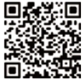
大會活動報名專區