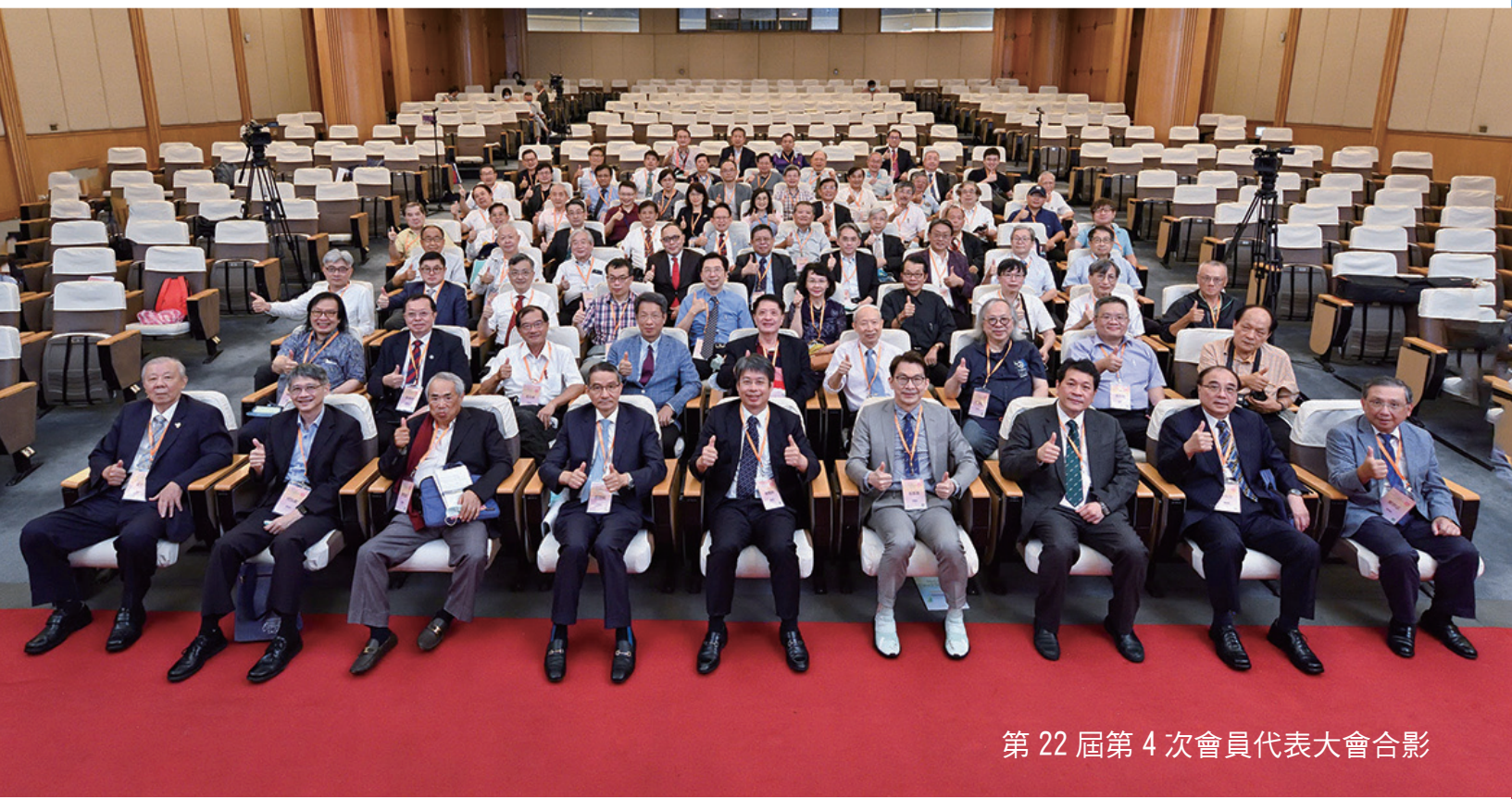
第 22 屆第 4 次會員代表大會合影